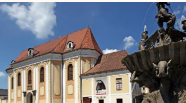
Vlastivědné muzeum v Olomouci